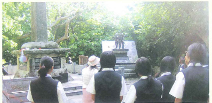
ひめゆりの塔の前で

司 会 私は卒業座禅でひっくりかえった覚えがありますが、今も受け継がれていることについて説明してください。