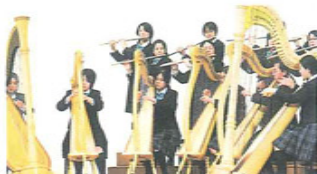
フェアリーコンサート