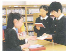
図書館 (岩瀬キャンパス)