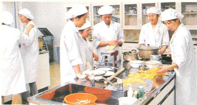
栄養価を計算しながら調理して

父が糖尿病から、神経障害になりました、更に胃癌になってしまい、私が大学二年のとき亡くなりました。