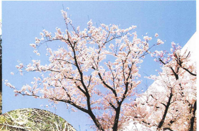
学園の庭に咲く花々