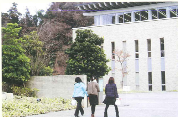
大船キャンパス 図書館

福 田(中) 身だしなみをチェックするための鏡が、各所にあります。岩瀬キャンパス本館一階から二階への階段踊場に大きな鏡が向かい合わせに二枚つけられていて相互に写し合っているので、自分の姿がいくつもいくつもあるように写っています。