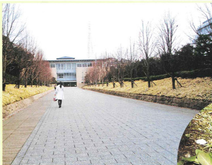
学びへの道-大船キャンパス 鎌倉市大船6-1-3