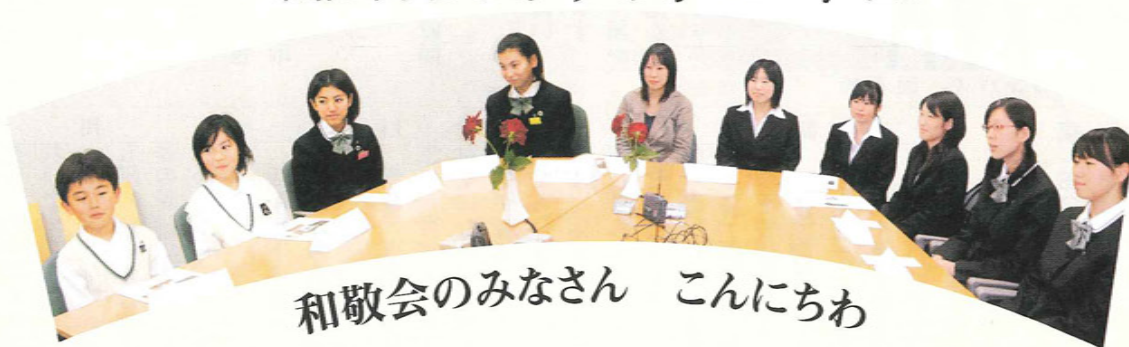
和敬会のみなさん こんにちは