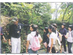
木の実も食べました